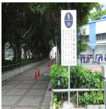
加強門禁及車輛管制措施保障學生行的安全