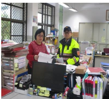
中山分局長春派出所簽訂巡邏箱保障校園安全