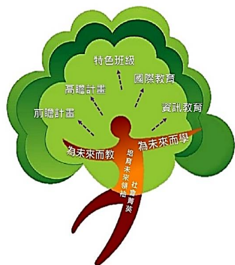
本校願景與發展特色

本校寬廣的校園中，種滿了綠意盎然的 200 多棵榕樹，因此本校學生自許為「榕城之子」。在「培育未來領袖、社會菁英」的學校發展願景下，營造大同高中成為「培育未來人才的明日學校」及培育擁有「人文與藝術涵養、科學與數位能力、社會關懷與全球視野」的榕城之子，便是本校的