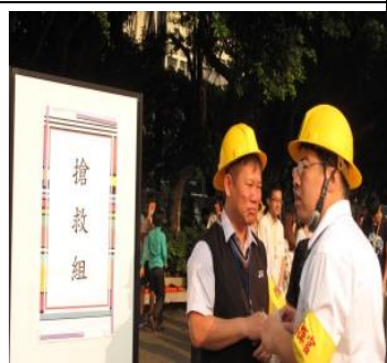
每年定期辦理複合式防災演練