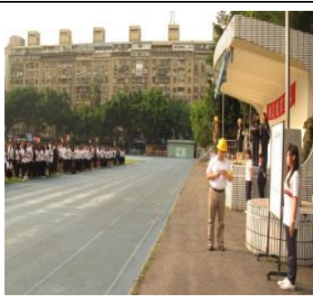
每年定期辦理複合式防災演練