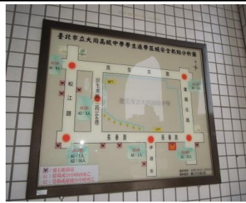
校園周邊通學區熱點分析讓學生上放學更安全