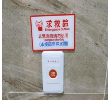
每間廁所都設有緊急求救鈴