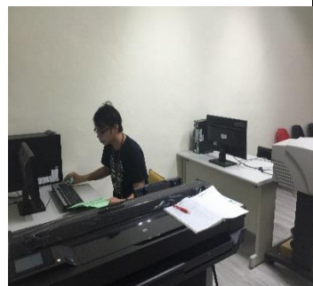
設置系統管理教師負責網路管理