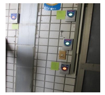
校園廣大機械保全 24 小時連線保障財產安全