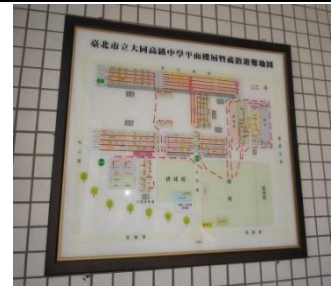
透過防災逃生避難圖讓學生了解防災逃生動線