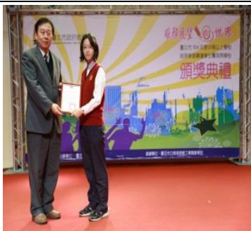
本校榮獲臺北市交通安全金安獎的肯定