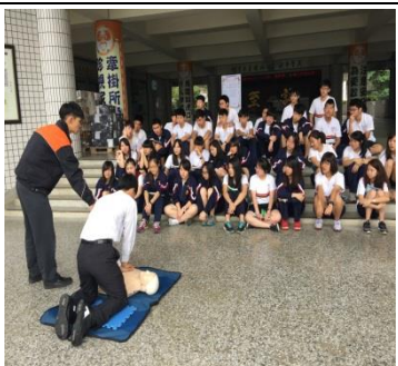
邀請消防隊定期辦理 CPR 研習-學生場