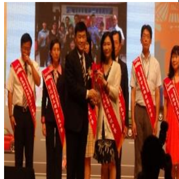
本校榮獲全國交通安全教育優等第一名肯定