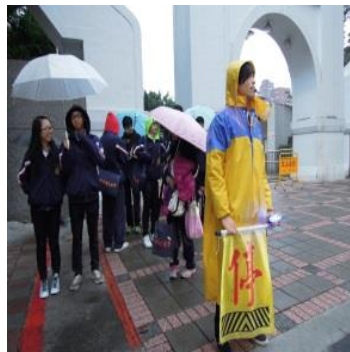
教官帶領交通隊協助學生上放學安全