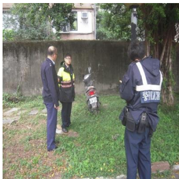
教官與警政單位編組巡邏校園周邊保障安全