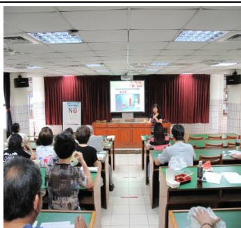
邀請消防隊定期辦理 CPR 研習-教學研究會老師場