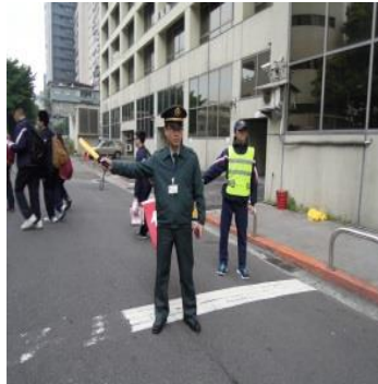
教官帶領交通隊協助學生上放學安全