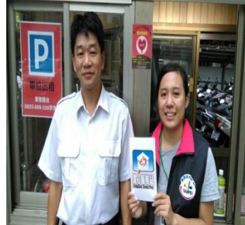
附近商家簽署愛心商店保障學生校外安全