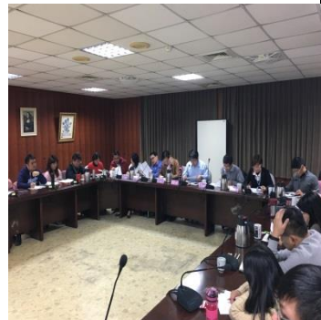
邀集校外相關單位召開防災及危機小組會議