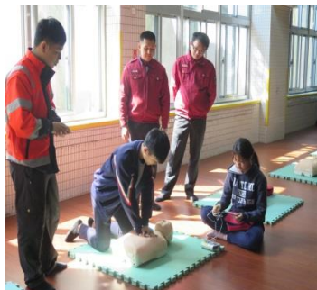
消防局協助校內 CPR 研習課程現場指導學生