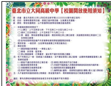
校園開放管制讓學生在校園內學習安全無疑