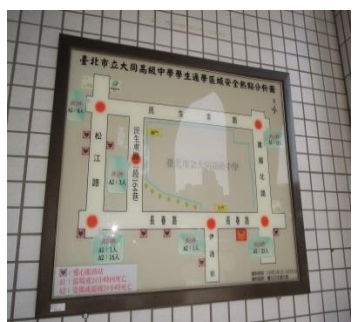
繪製通學熱點分析標示易發生危險區保障安全