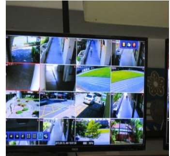
裝設監視系統清晰建置校園死角安全無疑