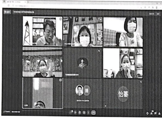
照片1：學校分工討論會議