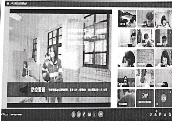
照片3：線上授課實況