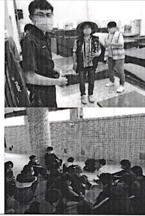
照片2：路線踏勘(1. 協同里長、長春派出所2. 教官指導309班全班學生演練)