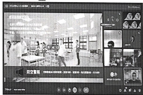
照片4：線上授課實況