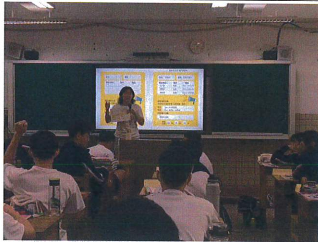
與家庭約定集合地點