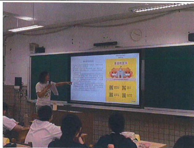
家庭防災卡填寫說明