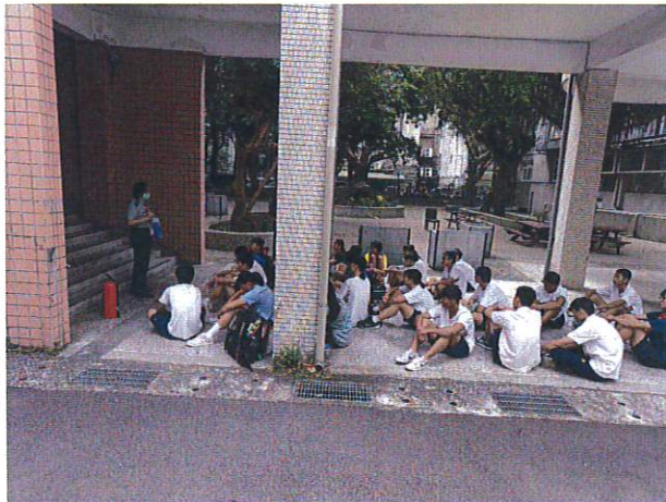
教官提問，學生回答