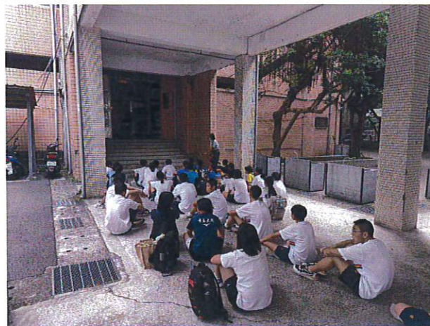
示範操作滅火器滅火